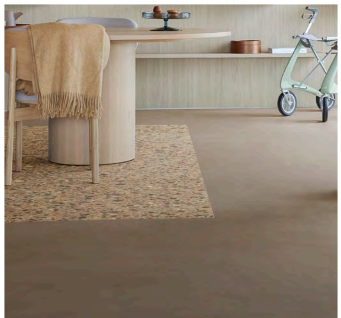
Allura decibel ivory antique oak