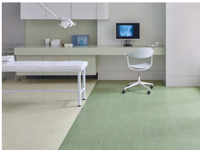
Allura decibel bianco perlino et pistacchio twill

À propos du Groupe Forbo. Acteur international majeur du revêtement de sol souple, le Groupe Forbo est le numéro 1 mondial sur le marché du linoléum et des sols textiles floqués (environ 5 050 personnes, au sein de 25 unités de production & de distribution, 6 centres de fabrication et 47 organisations de vente dans 39 pays, pour un chiffre d'affaires 2025 de 1 085,4 millions de francs suisses). Sa branche revêtements de sol "Forbo Flooring Systems" offre une large palette de revêtements et solutions décoratives pour les marchés professionnels et résidentiels. Linoléums, PVC, textiles aiguilletés compacts, textiles floqués, dalles tuftées et systèmes de tapis de propreté souples et rigides, conjuguent fonctionnalité, couleurs et design, offrant des solutions complètes adaptées à tous les environnements.